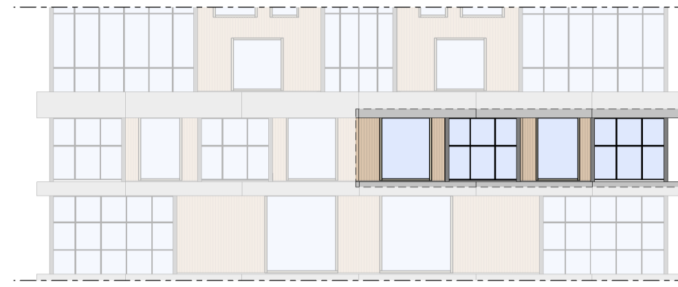
Noordgevel 1 : 200