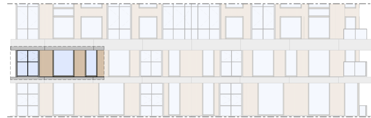
Westgevel 1 : 200