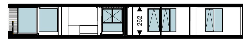
Doorsnede 1 : 200