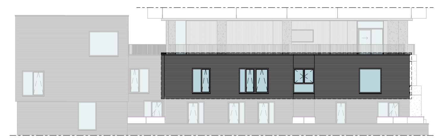
Noordgevel 1 : 200