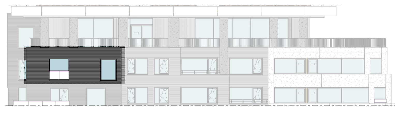
Westgevel 1 : 200