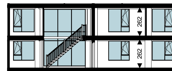
Doorsnede 1 : 200