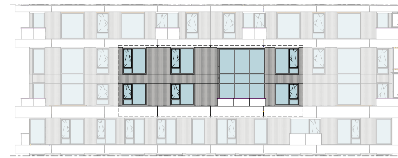
Oostgevel 1 : 200