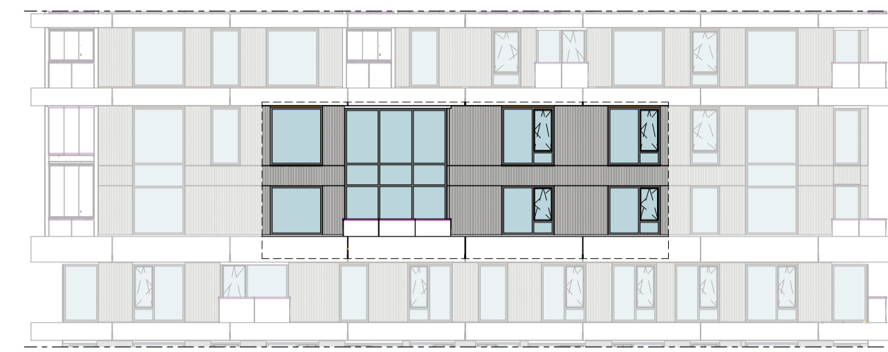
Westgevel 1 : 200