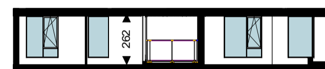
Doorsnede 1 : 200