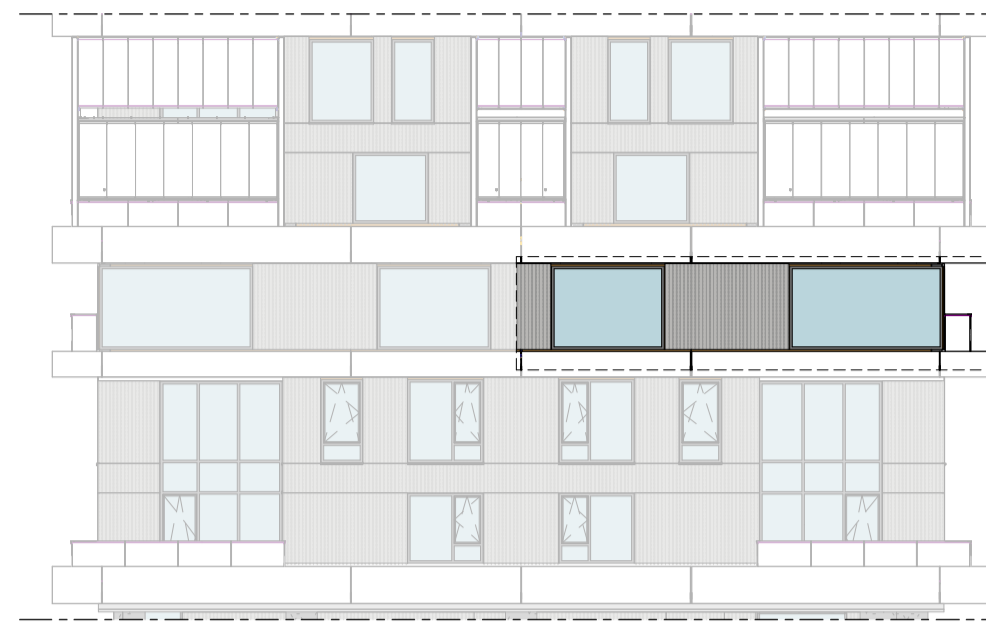
Noordgevel 1 : 200