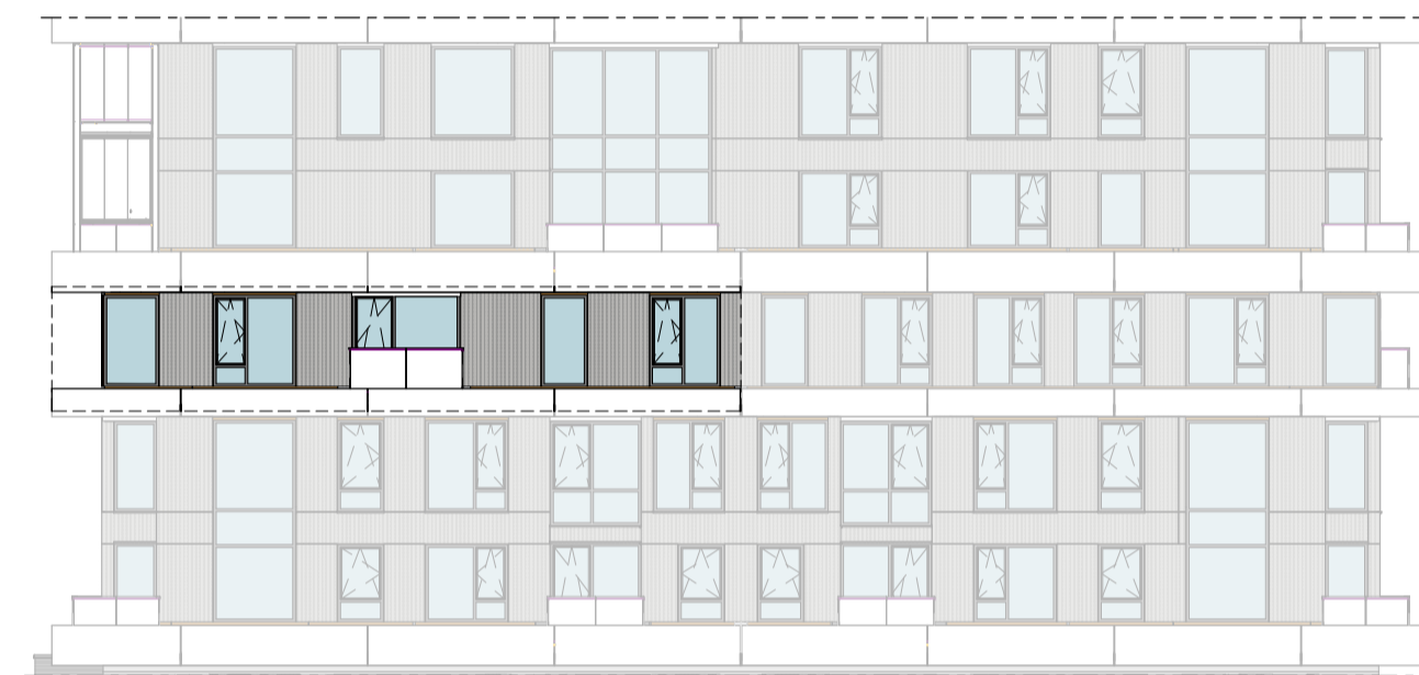
Westgevel 1 : 200