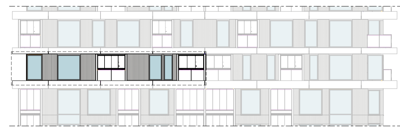
Westgevel 1 : 200