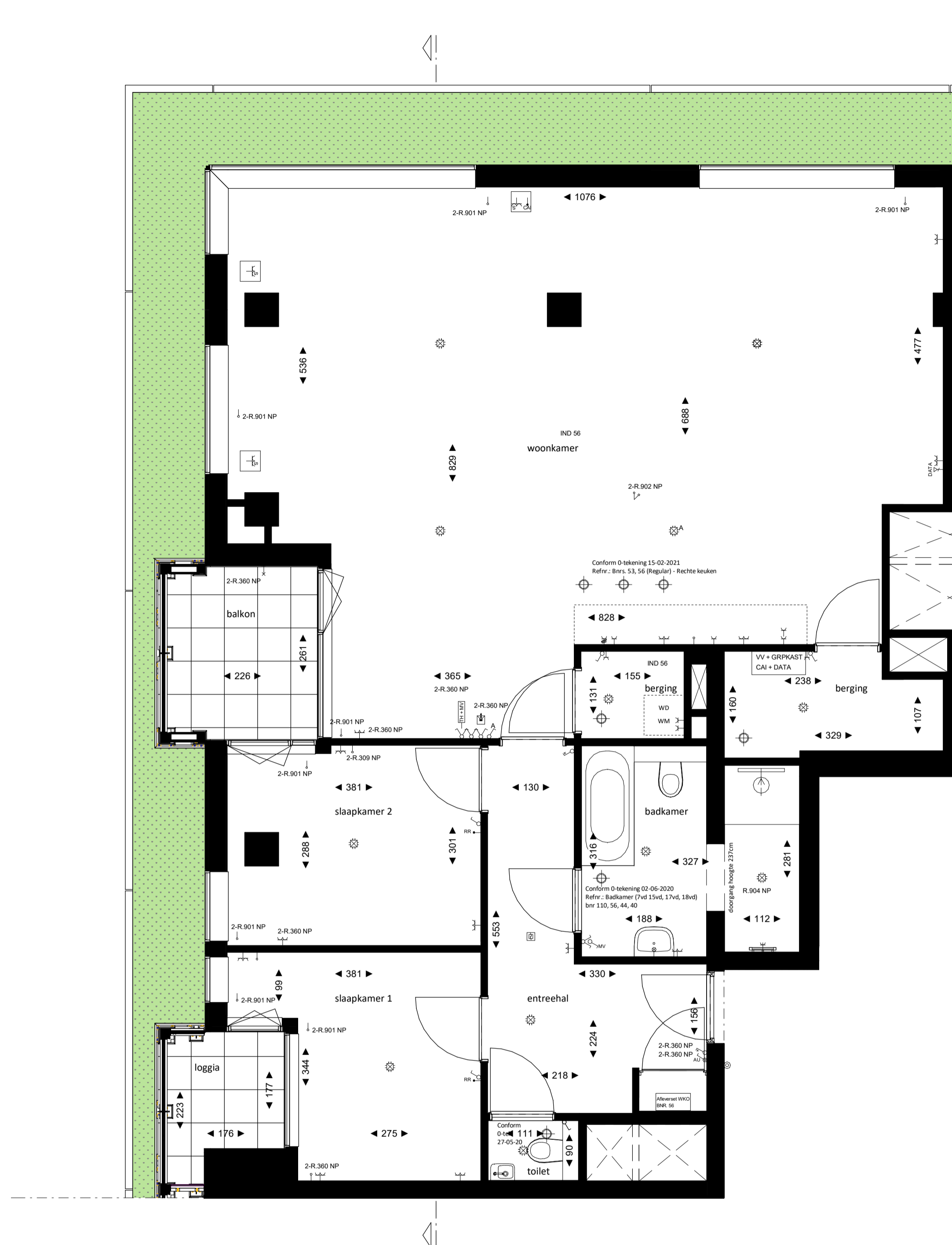
Plattegrond 1 : 50