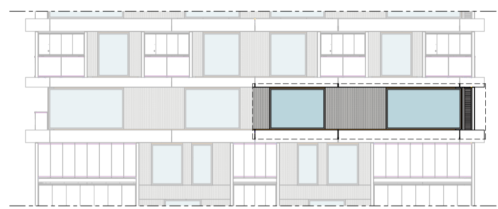
Noordgevel 1 : 200